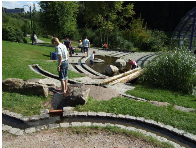
Loßburg Zauberland / Zauberwald