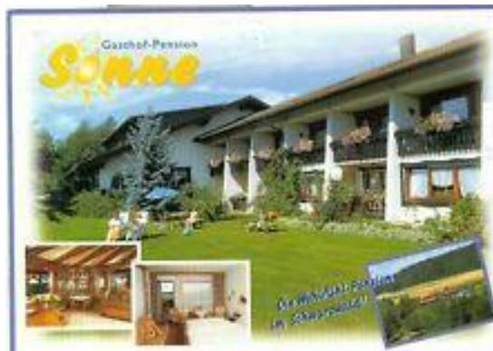
Gasthof „Sonne“ Grüntal